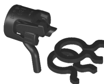
Kit Secteur 12